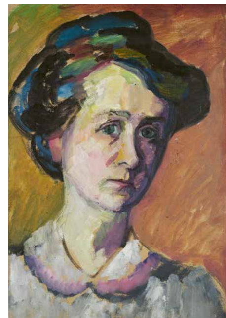
Gabriele Münter Selbstbildnis 1909 Öl auf Malpappe Schloßmuseum Murnau

Das den Ortskern bestimmende Schloßmuseum bietet seinen Besuchern eine erlesene Sammlung. Das Herzstück bilden Werke von Gabriele Münter sowie Arbeiten der Künstler der »Neuen Künstlervereinigung München« und des »Blauen Reiters« wie u. a. Wassily Kandinsky, Marianne von Wrefkin, Alexej von Jawlensky. Die Exponate veranschaulichen, wie die Künstler seit 1908 in Murnau und Umgebung ihre Bildmotive