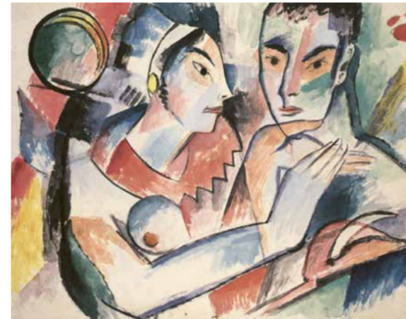
Heinrich Campendonk, Liebespaar (Adda und Heinrich), 1912, Museum Penzberg – Sammlung Campendonk

Das Osterseen-Gebiet, das sich vom Starnberger See hinein in die wellige Voralpenlandschaft bis nach Penzberg zieht, ist eine echte Schatzkammer der Natur. Die 19 Seen bei Iffeldorf bieten ein beeindruckendes Farbspiel von silbriggrau bis türkisgrün vor einem unvergleichlichen Alpenpanorama: ein Landschaftszauber, der Anfang des 20. Jahrhunderts Franz Marc nach Sindelsdorf gezogen hat. Und mit ihm seine Kunstfreunde Kandinsky, Jawlensky und Münter, die oft in seiner Gartenlaube zu Gast waren. Mit 21 Jahren kam 1911 Heinrich Campendonk (1889-1957) aus dem Rheinland nach Oberbayern und wurde das jüngste Mitglied der Künstlergemeinschaft »Der Blaue Reiter«. Auf der Suche nach eigenen Motiven beeindruckte ihn die Bergwerksstadt Penzberg mit ihren besonderen Koloniehäusern und Bergwerksanlagen. Die Bilder aus dieser Phase waren für ihn aber nur der Einstieg in ein eigenes, sehr selbständiges Kunstschaffen, das bis in die 1950er-Jahre reicht.