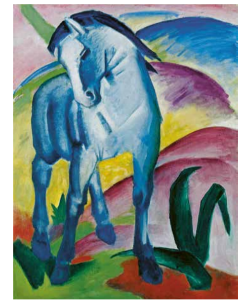
Franz Marc Blaues Pferd, 1911

Eine Fülle von hochkarätigen Museen und Sammlungen mit Exponaten von der Antike bis zur Gegenwart gibt es in München zu entdecken. Jahrhundertlang förderten die Wittelsbacher die Kunst in der Residenzstadt, die heute in zentraler Lage ein Kunstareal mit Museen von Weltrang zu bieten hat. Hier erwartet Sie z. B. die weltweit größte Sammlung an Werken des »Blauen Reiters«. Das Museum in der ehemaligen Künstlerresidenz des Malerfürsten Franz von Lenbach zählt mit seinem idyllischen Garten zu den schönsten Orten der Stadt. Das im Stil einer toskanischen Villa erbaute Gebäude steht in spannendem Verhältnis zum gold-glänzenden Neubau des Architektenbüros Foster + Partner. Seit der Schenkung 1957 durch die Künstlerin Gabriele Münter beherbergt das Museum Arbeiten von Wassily Kandinsky, Gabriele Münter, Alexej von Jawlensky, Marianne von Wrefkin, Franz Marc, Paul Klee, August Macke und vielen anderen. Unter dem Namen »Blauer Reiter« fand