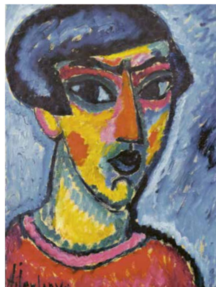
Alexej von Jawlensky Kopf in Blau, 1912 Buchheim Museum der Phantasie

Kultureller Höhepunkt ist das Buchheim Museum der Phantasie, das Olympia-Architekt Günter Behnisch ans Bernrieder Ufer des