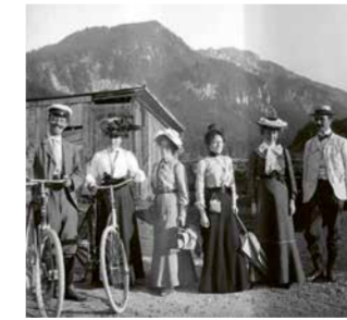
Bildnachweise: Titel: Erich Heckel, Der schlafende Pechstein, 1910 (Detail), Buchheim Museum, Bernried ©Nachlass Erich Heckel, Hemmenhofen | Bayerische Seenschiffahrt: Tourist Information Starnberg | StOA169: Foto Erwin Rittenschöber | Künstlerdorf Polling: Marian Zazeela. © La Monte Young and Marian Zazeela 2001 | Münter-Haus: Foto Wolfgang Ehn | Kochel- und Walchensee: Tourist Information Kochel a. See, Foto Thomas Kujat | Akademie der Bildenden Künste München: München Tourismus | Panoramakarte: ©Tourismus Oberbayern München e.V. | Staffelsee: Foto Florian Werner | Schloßmuseum Murnau, Bildarchiv, Foto: G. Pflüger | Werdenfelsbahn: Foto Uwe Miethle | Franz Marc Museum: Foto Doris Leuschner | Kochel- und Walchensee: Tourist Information Kochel a. See, Foto Thomas Kujat | Starnberger See: Tourist Information Starnberg | Buchheim Museum am Starnberger See: Foto Julia Rejmer | Lenbachhaus: © Florian Holzher | München: München Tourismus, Foto Thomas Klinger | Museum Penzberg: Foto Christian Krinninger | Osterseen: Tourismusverband Pfaffenwinkel

Von München über Bernried, Penzberg, Murnau und Kochel a. See per Rad die Landschaft erleben, die schon Franz Marc, Gabriele Münter und Wassily Kandinsky inspiriert hat. Gesamtlänge: 238 km www.museenlandschaft-expressionismus.de