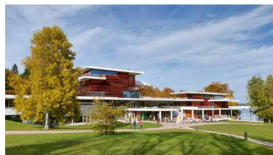
Buchheim Museum der Phantasie

Starnberger Sees setzte. Neben der berühmten Expressionistensammlung von »Boot«-Autor Lothar-Günther Buchheim begeistern Kunstwerke aus aller Welt. Kinder lieben den Zirkus Buffi, den Unterwasser-BMW, den bunten Hubschrauber und das Labor der Phantasie zum Klettern und Werkeln. Ein hochkarätiges Programm zieht ganzjährig viele Besucher an. Der romantische Museumspark lädt zum Picknick ein.