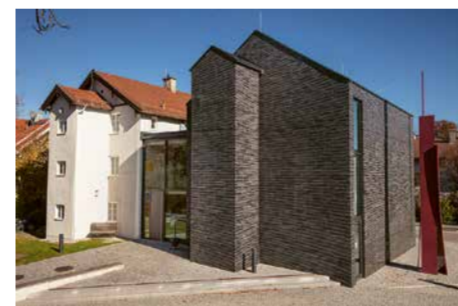
Museum Penzberg – Sammlung Campendonk

Das Museum Penzberg – Sammlung Campendonk beherbergt seit 2016 die weltweit größte Sammlung seiner Werke. Besonders mit seinen Hinterglasmalereien hat er Kunstwerke von ganz eigener Schönheit, Meisterschaft und Faszination geschaffen.