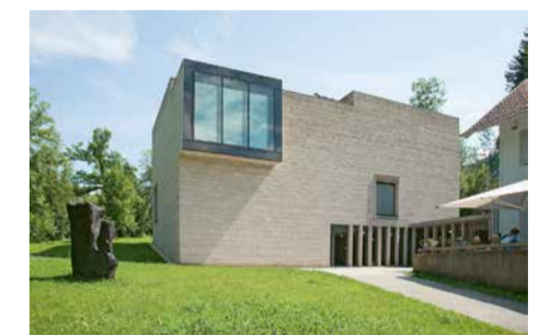
Franz Marc Museum – Kunst im 20. Jahrhundert